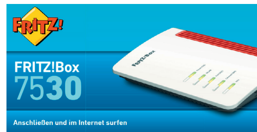
FRITZ!Box-Anleitung (je Modell abweichend)

Ihre neue FRITZ!Box schließen Sie mit dem beiliegenden Kabel an den mittleren Steckplatz der Telefondose an. Details entnehmen Sie bitte der FRITZ!Box-Anleitung.